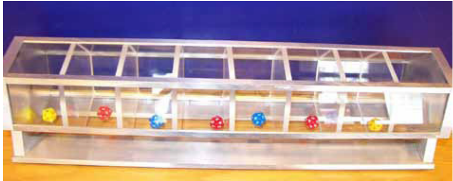
Tölvan fær 48 stafa tölu úr þessum stokk sem er snúid á höndum

margir viðskiptavinir okkar eru með miðakaupum sínum að þakka fyrir þjónustu sem þeir eða fjölskyldur