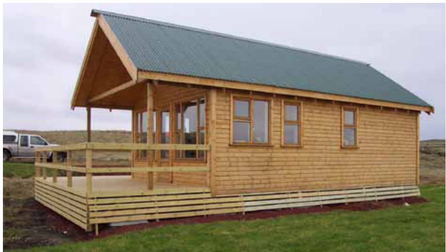
Þetta sumarhús á eignarlóð var í vinning árið 2004.

drættisins er að koma út, framleiddir hafa verið bolir með merki happdrættisins, öllum jafnöldrum þess á